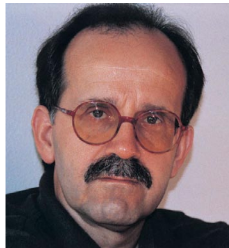
Agustín Fernández Paz

Son novelas de miedo Cartas de inverno (Premio Rañolas 1995) y Aire negro (Lista de Honor del IBBY 2002). La primera de ellas da cuenta del