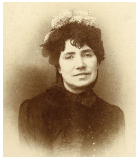
Rosalía de Castro

Desde 1859, año en el que publica la novela La hija del mar , Rosalía vive habitualmente en Santiago de Compostela. Allí verán la luz, sucesivamente, la novela Flavio (1861) los poemas en Álbum de la caridad (1862), y los libros A mi madre (1863) y Cantares gallegos (1863), obra fundamental de la historia de la literatura de Galicia y cuya fecha de publicación fue es-