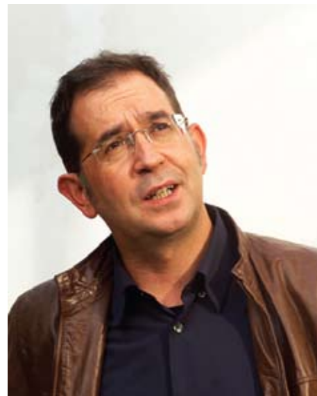
Suso de Toro

En 1996 salen a la luz Conta saldada y los ensayos Eterno retorno y Parado na tormenta . Y sólo un año después Calzados Lola gana el Premio Blanco Amor. En esta obra se desarrollan dos líneas narrativas: la de acción, con investigaciones, y la introspectiva, con desintegración y reconstrucción